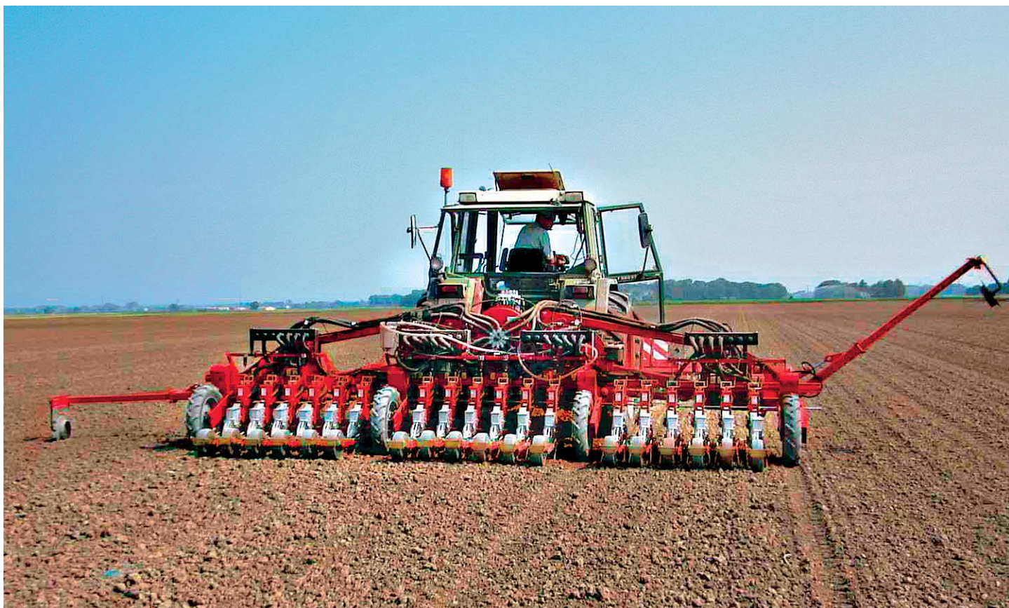
Seminatrice al lavoro su campo. Seed drill at work in the field. Sämaschine bei der Arbeit auf dem Feld Semoir à l'utilisation sur le champ. Sembradora a trabajo en el campo.